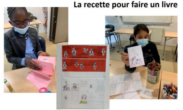
La recette pour faire un livre

« Douaa 17 ans lycéenne » « Organiser un séjour tous ensemble c'était top ! Une nouvelle expérience pour moi, ça m'a responsabilisé, j'ai voyagé seule comme une grande ! Les activités étaient vraiment bien, l'ambiance aussi ; une découverte totale des activités avec de l'adrénaline en plus ! »